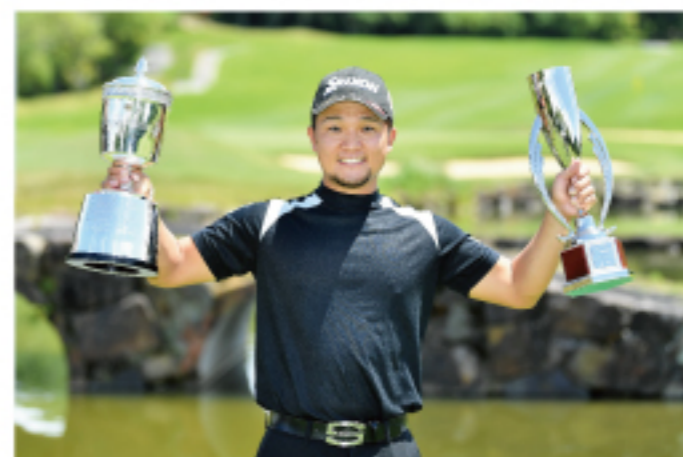
2021年九州オープン優勝 香妻陣一郎選手